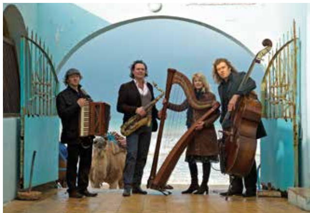
Quadro Nuevo spielt am 25. März im Rathaus der Gemeinde Visbek.

jeweils den ECHO Jazz als bester Live Act und wurde so mit dem höchsten Deutschen Musikpreis von der Deutschen. Quadro Nuevo gründete sich 1996. An irgendeinem grauen Januartag jenes Jahres trafen sich vier junge Herren zum ersten Mal auf einem Parkplatz in der Nähe von Salzburg. Die Vier kannten sich vorher kaum und sollten Filmmusik für den ORF einspielen. Die Gage hierfür wurde anschließend im örtlichen Spielcasi-