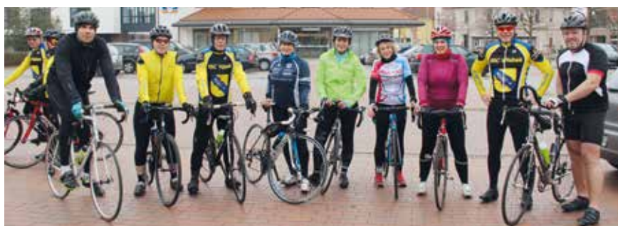
Der RSC freut sich über neue Mitglieder und lädt herzlich zum Probetraining ein.

Nach der Winterpause und dem Saisonauftakt Ende Februar starten die Mitglieder des Radsportclubs