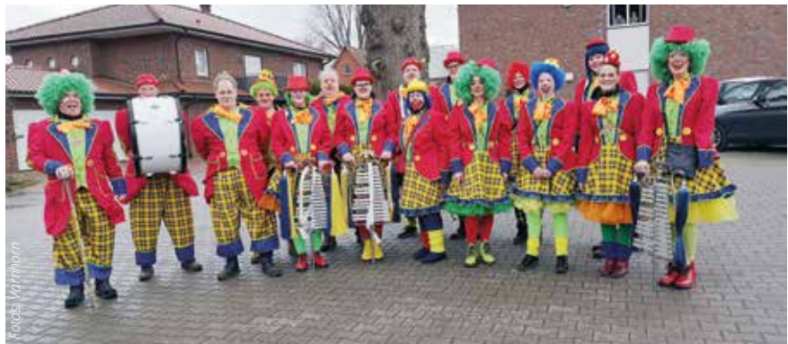
Trotzten dem Regenwetter: Die Mitglieder des Spielmannszugs Visbek beim Karnevalsumzug in Damme.