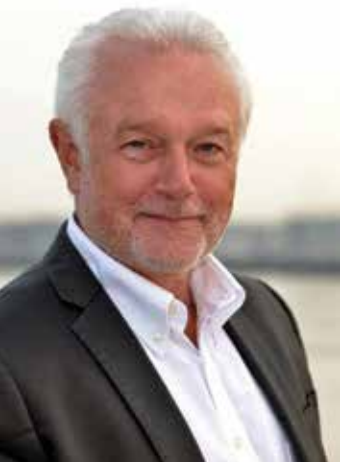
Wolfgang Kubicki als Ehrengast bei Visbeks FDP am 9. Mai.

Bundestagsvizepräsident ist Ehrengast auf der Jubiläumsveranstaltung der FDP