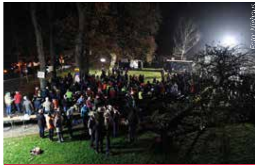
Gut besucht war das Adventssingen unter dem Motto „Wöstendöllen ist bunt“.

Mehr als 350 Menschen kamen kurz vor Weihnachten in Wöstendöllen zusammen und sich damit an einem Protest gegen die Alternative für Deutschland (AfD) beteiligt. Gemeinsam organisierte die Dorfgemeinschaft ein Adventssingen unter dem Motto „Wöstendöllen ist bunt“. Auf selbst gestalteten Plakaten und Bannern machten die Teilnehmer deutlich, was sie von der