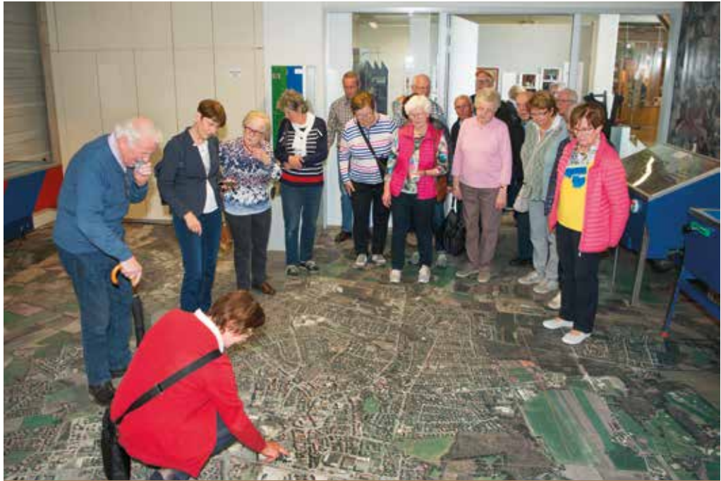
Gemeinsam Interessantes entdecken – dafür stehen die Bildungsfahrten, die der Heimatverein Visbek regelmäßig anbietet.

Am Donnerstag, den 16. April fahren wir nach Papenburg. Hier besuchen wir zunächst die MEYER WERFT von 14 bis 16 Uhr. Anschließend geht es zum Kaffeetrinken. Ab ca. 17 Uhr begleitet uns ein Gästeführer durch Papenburgs Kanalstadt (Deutschlands längste Fehn-Kolonie) und berichtet uns über Sehenswürdigkeiten und Wissenswertes vom Moor zum Meer. Anmeldung bei Eduard Langfermann, Tel.: 04445-2205 Abfahrt: 12:30 Uhr, ZOB Benedikt-Schule, Rückkehr: ca. 20 Uhr