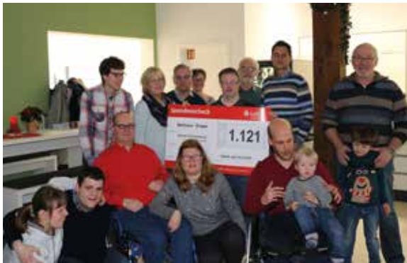
Bartimäus-Gruppe freut sich über die Spende der Dorfgemeinschaft Wöstendöllen.

rechtspopulistischen Partei halten. Hintergrund war die AfD-Veranstaltung „Bundesfraktion im Dialog!“ im Wöstendöller Gasthaus „Zur Linde“ mit etwa 60 Gästen.